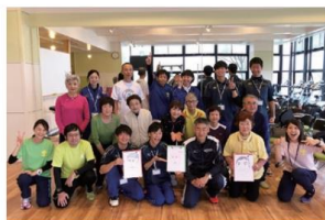
楽しい2日間でした!