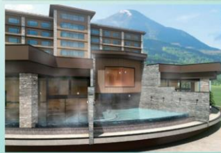
湖畔混浴「空」 ※湯着み着でご利用頂きます