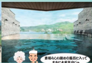
素晴らしい眺めの風呂に入ってまさに大気分じゅ ※画像はイメージパースです