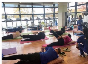
ネモケン先生スペシャル講座