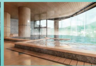
天然温泉 湖畔の湯「木の湯」 ※男女時間入替