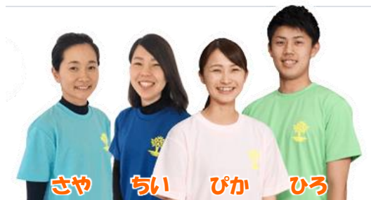
さや ちい ぴか ひろ